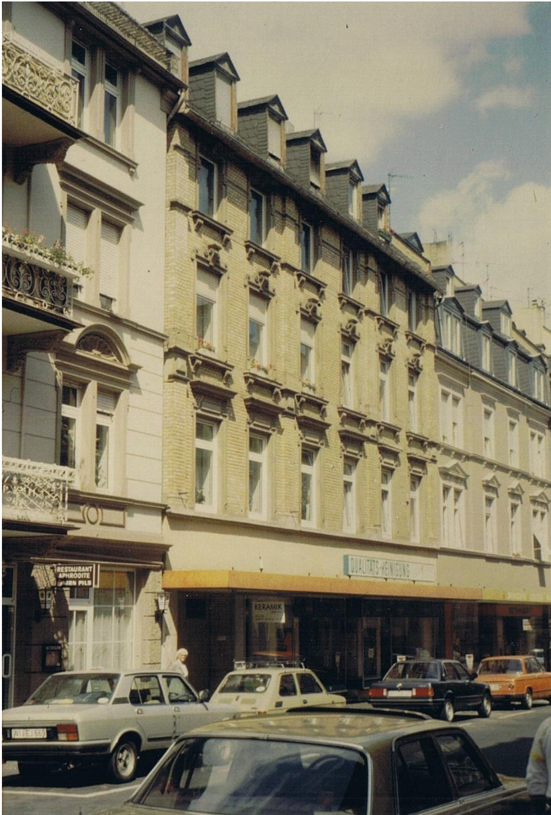
Abb. 2: Die Wellritzstraße 55 im Jahr 1991