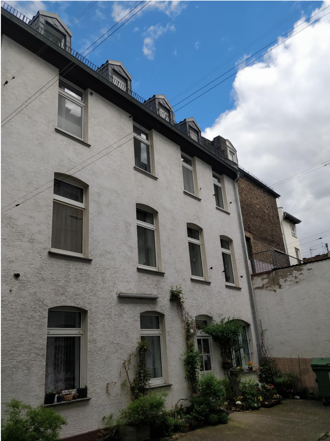
Abb. 4: Das Hinterhaus mit Dachgeschosswohnung

Die Anfangsmiete 1936 betrug 21 Reichsmark plus eine Mark Wassergeld. 1975, als meine Mutter nach dem Tod unseres Vaters auszog, zahlte sie eine monatliche Miete von 85 DM. Das war immer noch relativ wenig. Dafür war in diesen 40 Jahren kaum etwas verändert oder modernisiert worden. Lediglich die Fenster, die durch Kriegs-