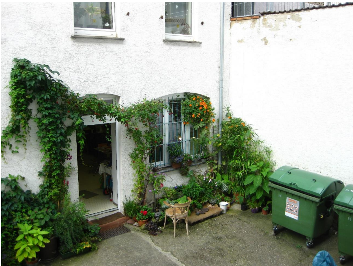
Abb. 10: Das heutige Keramikstudio Hein im Ersten Hinterhof