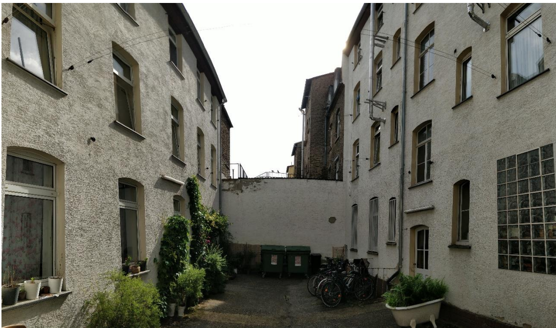
Abb. 3: Hinterhaus und Vorderhaus der Wellritzstraße 55

Wir wohnten im Hinterhaus unter dem Dach. 1936 waren meine Eltern dort eingezogen. Damals wurde mein Vater im Adressbuch als „Schuhmachermeister“ eingetragen, 1950 als „Arbeiter“. Meine Eltern bewohnten mit ihrer immer größer werdenden Kinderschar eine Zweizimmerwohnung mit Küche von etwa 40 Quadratmetern. Ein Bad gab es nicht. Am Samstag war Badetag für uns Kinder. Eine Zink-Waschbütte wurde in der Küche aufgestellt und mit warmem Wasser gefüllt. Glücklicherweise war derjenige, der zuerst hineingesteckt wurde. Leider war ich der Jüngste, 1944 geboren, und damit der Letzte und musste oft in eine graue, lauwarmer Pfütze steigen. Als Toilette diente ein Holzklo mit Wasserspülung, das wir mit den Nachbarinnen teilen mussten. Um es zu erreichen gingen wir durch das Treppenhaus eine halbe Etage tiefer. Oft war es schon von einer Nachbarin besetzt.