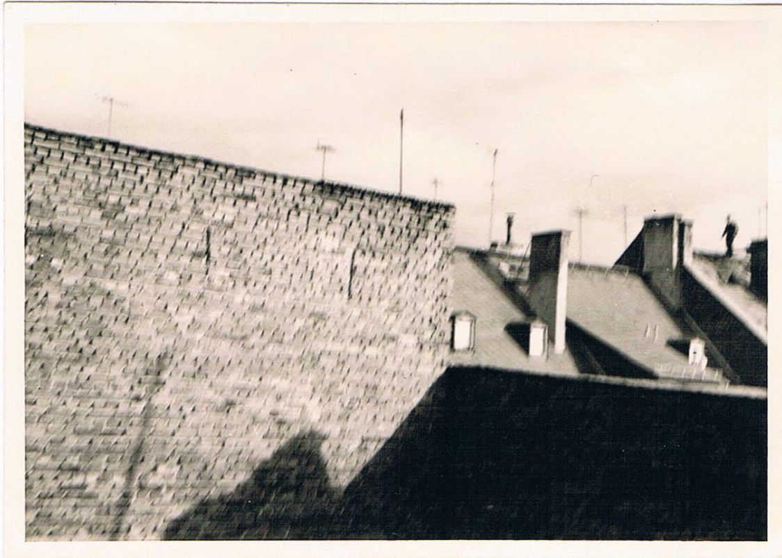
Abb. 5: Blick vom Hinterhaus auf die Brandmauer (um 1960)

Nach mehr als 70 Jahren stehe ich in meinen Gedanken wieder in unserem Wohn- und Kinderzimmer, blicke aus einem unserer Mansardenfenster auf das Vorderhaus und lasse seine Bewohner von damals Revue passieren. Mein Blick wandert systematisch beginnend vom Parterre des Vorderhauses durch alle Stockwerke bis zum Dachgeschoss. Die Familiennamen wurden in diesem Text alle geändert. Lediglich der Name der damaligen Hauseigentümer, die auch gleichzeitig einen Zigarrenladen führten, werden mit Genehmigung der Nachkommen genannt.