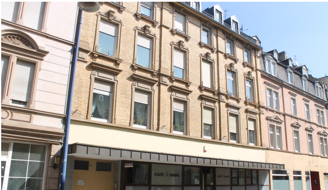
Abb. 1: Die Wellritzstraße 55 im Jahr 2021

In den Sommermonaten erstrahlt die Backsteinfassade des Hauses Wellritzstraße 55 in ihrer ockerfarbenen Pracht. An langen Wintertagen erfreuen sich nur die oberen Stockwerke des Sonnenlichtes. Der braungraue Backstein der Hoffassaden von Vorder- und Hinterhaus ist inzwischen weiß verkleidet, aber von September bis März wirkt der Innenhof der Wellritzstraße 55 dunkel und trist.